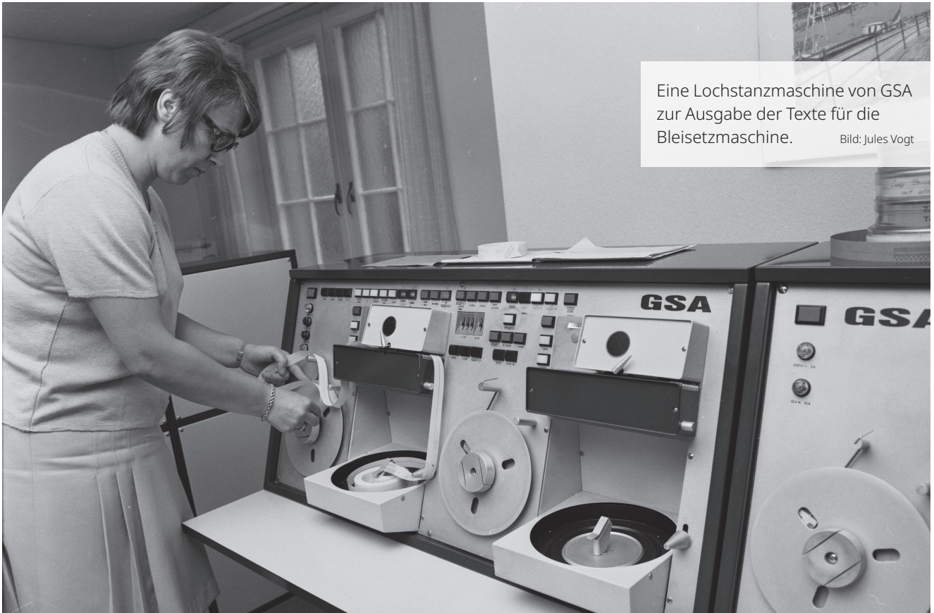
Eine Lochstanzmaschine von GSA zur Ausgabe der Texte für die Bleisetzmaschine.