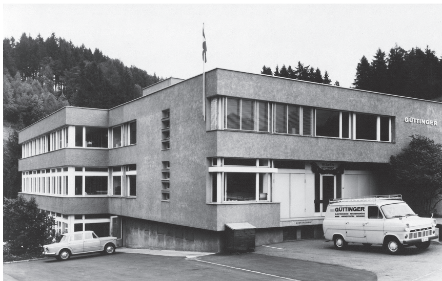
Bild 2 Firmensitz der Güttinger AG in Teufen.

Beim zehnjährigen Jubiläum der Firma in 1967 zählte das Unternehmen 97 Mitarbeiter und verbaute etwa eine Million Halbleiter pro Jahr (Bild 2). Zudem wurde in Bad Waldsee bei Ravensburg das Tochterunternehmen Güttinger GmbH ausgebaut.