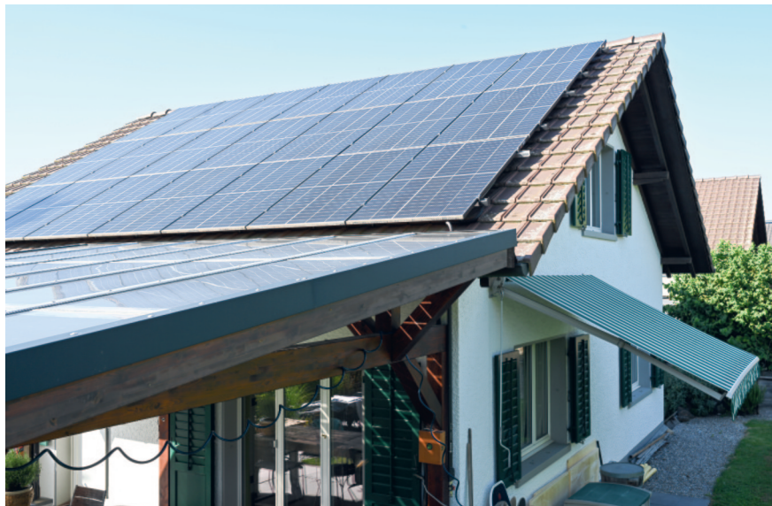
Integration von Solarstrom ins Wohngebäude: ein Grundpfeiler der Energiewende.

Nun gibt es aber auch das intelligente Stromnetz nicht umsonst und auch hier müssen zunächst noch Antworten auf dringende Fragen gefunden werden. So fehlt bisher eine einheitliche Schnittstelle, über welche Elektrizitätswerke und Verbraucher miteinander kommunizieren können. Zudem ist bislang nicht geklärt, wie Wärmepumpen oder E-Ladestationen als Verbrau-