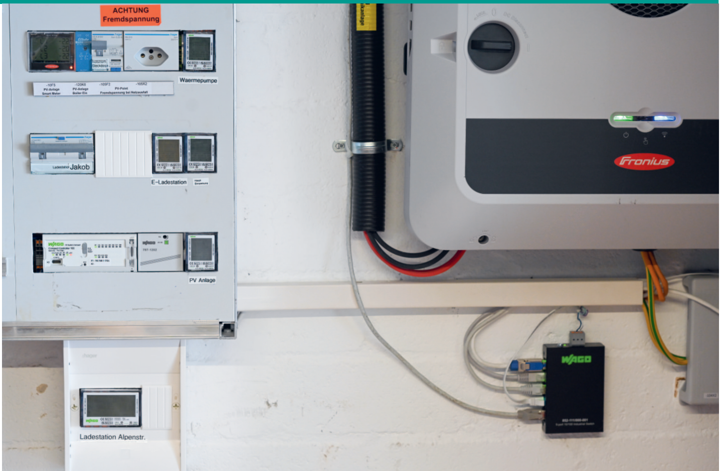
Technische Infrastruktur des HEMS-Projekts.