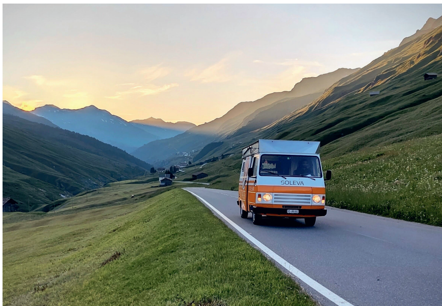
Figure 1 Lors des déplacements, les panneaux solaires déployables sont rangés sous la surface photovoltaïque centrale.

Spécialement conçue par l'équipe, cette structure devait être à la fois légère, facile à manipuler et robuste pour résister aux intempéries. De plus, la surface solaire principale, au centre de la structure ( figure de titre ), est en permanence exposée au soleil, mais aussi au vent et à la grêle. C'est pourquoi Soleva est entrée en partenariat avec le CSEM, à Neuchâtel, qui a développé des panneaux solaires en composites, à la fois légers et résistants. Les autres panneaux sont rangés sous la surface principale lorsque le véhicule est en mouvement ( figure 1 ). Grâce à un système de coulisses, ceux-ci peuvent être déployés dans les quatre directions lorsque le véhicule est à l'arrêt, pour atteindre une surface active totale de 25 m 2 et une puissance nominale de 5,1 kW ( figure de titre ). Enfin, la structure est inclinable afin de pouvoir optimiser la charge solaire en début et en fin de journée.