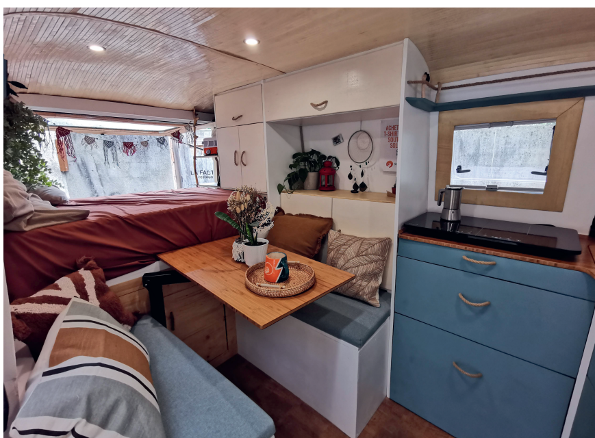
Figure 2 La partie habitat du van électrique solaire est essentiellement réalisée à partir de matériaux naturels (bois, bambou, liège, etc.).