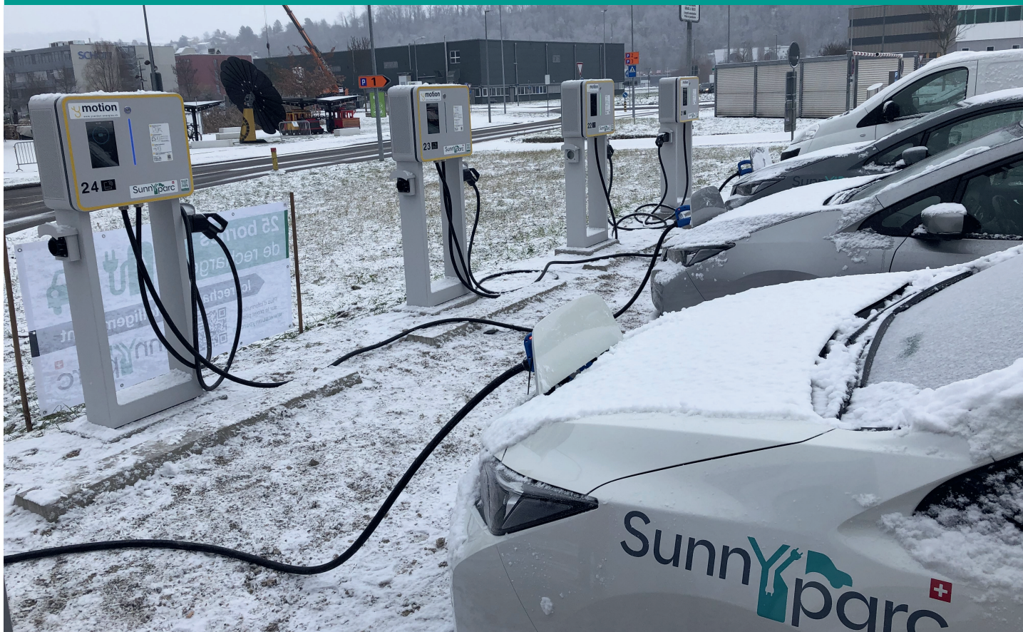
Décharge V2G simultanée de trois véhicules à 10 kW.