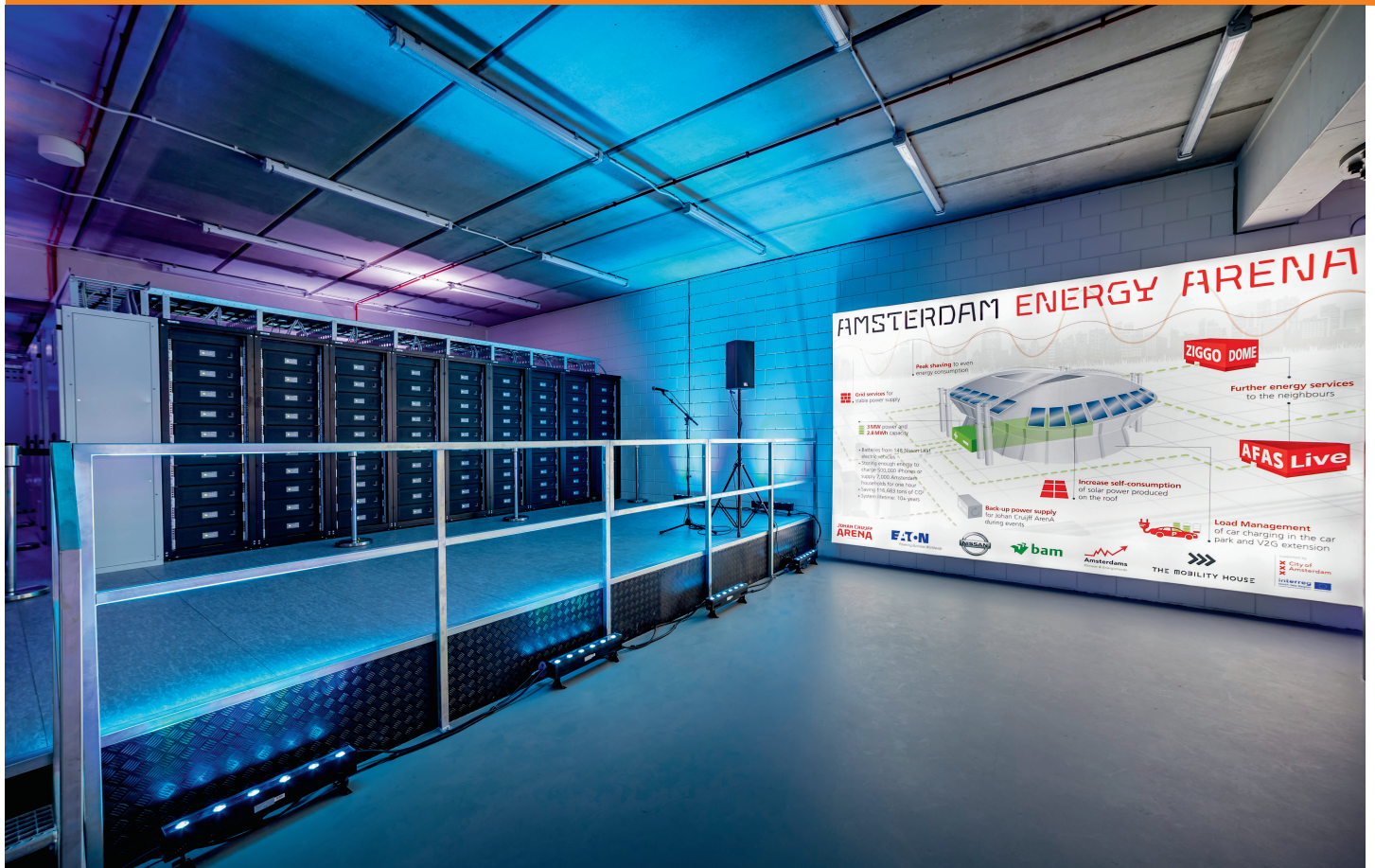
Le système de stockage d'énergie de 3 MW de la Johan Cruyff Arena, aux Pays-Bas, comprend des batteries de véhicules électriques de seconde vie [1].