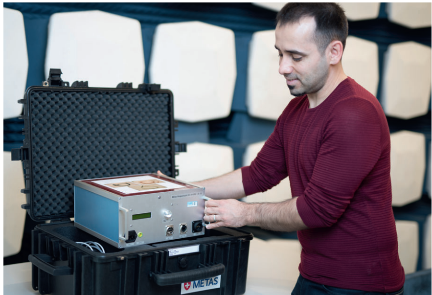
Figure 1 Appareil pour valider les essais d'immunité conduite selon la norme IEC 61000-4-3.

Les essais de compatibilité électromagnétique visent à assurer le bon fonctionnement d'un appareil électrotechnique via une immunité suffisante aux perturbations provenant de leur environnement ainsi qu'à réduire leurs émissions électromagnétiques. Ils s'appliquent à tous les appareils électriques, que ce soit la perceuse, le téléviseur, la télécommande de porte de garage, l'ordinateur, ou la machine à laver, et sont définis précisément dans des normes techniques. Ils nécessitent une infrastructure d'essais spécifique et onéreuse, ainsi qu'un grand savoir-faire. Pour contrôler les aptitudes des laboratoires d'essais en compatibilité électromagnétique, il n'existait jusqu'ici pratiquement pas de validation par un essai sur un échantillon de référence. Et ce, pour la raison suivante: